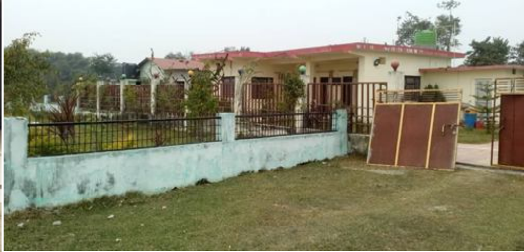
सप्तरीको हनुमाननगर कंकालिनी नगरपालिका वडा नं. ८ स्थित रहेको गेष्ट हाउस ।